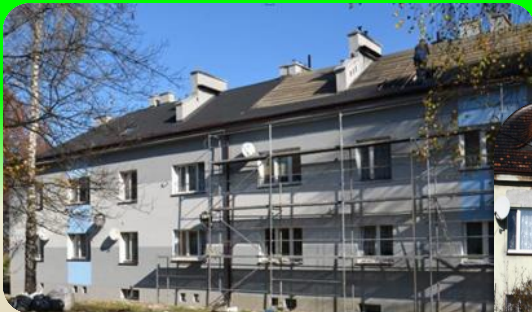
Ul. Brzezińska 47-55A