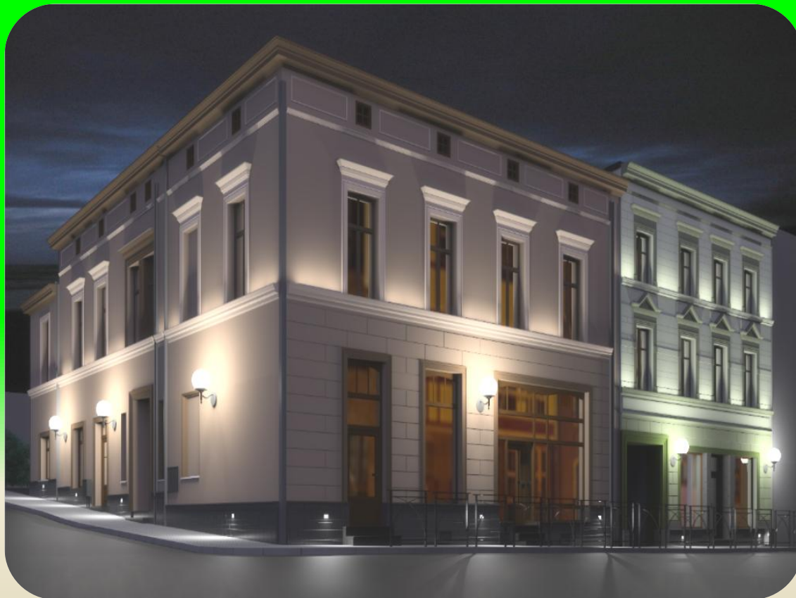
Wizualizacja panoramy pierzei ŻWIRKI I WIGURY 2 / BYTOMSKA 9